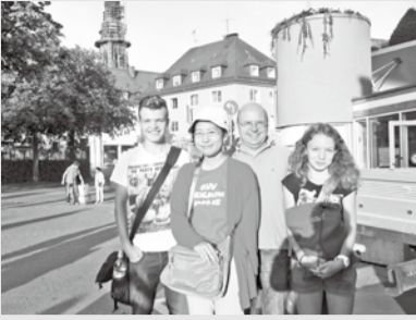
ホストファミリーと一緒に

伝えたいという気持ちで、簡単なことや自分の気持ちはなんとなく伝わります。でも、どう言うかわからない、知らないことは伝えられません。それが分かったこの研修旅行は素晴らしい経験となりました。私の目標がいつか達成できるように、英語の勉強にもっと力を入れるのはもちろん、日本史や地理、政治のことなど日本や松山に関わる勉強も頑張りたいです。