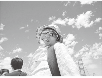
白い企画を考えて

たくさんの方々の大きな支援を受けてやりと成り立った、十日間の長いアメリカでの研修で僕が知ったのは、面積が日本の25倍というほど広い、自由の国アメリカで独自の発達を遂げた、日本では考えられないような壮大な文化、そして常識の数々でした。現地に着いて、まず驚きだったのは、モノの大きさと、高い物価でした。日本でいうと、Lサイズの大きさの食べ物、現地ではSサイズで出てきました。物価も高く、大抵は日本の1.5〜20倍、高いところで3倍もして、僕のお財布は厚みが減る一方でした。食べ物はおいしくて、ステイ先のグランマの作ってくれたハンバーガーは絶品でした。簡単な英語でも会話できて、アメリカカンジョークも面白くて、僕はすぐにステイ先で打ち解ける事ができました。からっとした気候も僕にはちょうどよく、快適に過ごせました。バスの中やステイ先の車の中では、外の風景を見る事が多かったのですが、その時に気づいた事は、日本のように高い建物ほとんどなかった事と、たくさんアメリカ車が走っていた事です。アメリカでの生活は、友達との楽しい会話や、色々な所に連れて行ってくれたステイ先、面白い企画を考えて