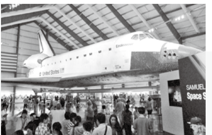
ここでの経験は必ず大人になった自分活きてくるだろうと思っています。