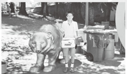
僕が、体験し、学んだことは、2つあります。1つめは、英語が分からなくてもジェスチャーで伝えることができるということです。ホームステイ先で、夕食を食べたときのことです。言葉が出てきませんでした。何とか伝えようと、身振り手振りで頑張りましたが、伝わりました。その時は、ジェ

スチャーでも、伝えることができるんだということ学びました。2つめは、アメリカは何でもかいいことなんです。ショッピングモールの端から端まで行くのにも疲れたり、スーパーマーケットのペットボトルが2リットルの大きさが2倍の大きさだったり、びっくりしたことがたくさんありました。