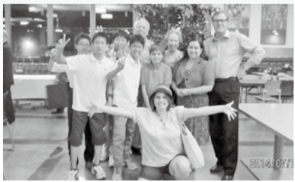
この11日間、自分はカリフォルニア州のサクラメントやロサンゼルスなどの様々な場所を訪れ、たくさんの方々の経験をしました。それらの経験はどれも自分にとって良い経験となりました。サクラメントに滞在していた間は、大学生の人達や、ホームステイ先の家族の人達と、たくさん英語を使う機会がありました。自己紹介、部屋や機械の使い方、値下げの交渉、ちょっとしたジョークのやりとりまで全て英語を使うのはとても大変でしたが、相手に自分の英語が伝わって安心しました。塾や学校、そしてなによりまっつやま国際交流センターで学習してきた甲斐がありました。