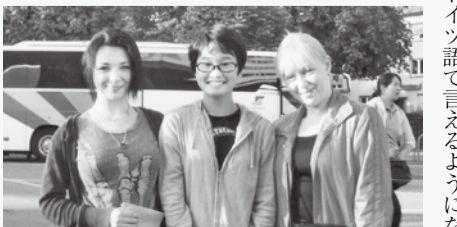
ホストファミリーと