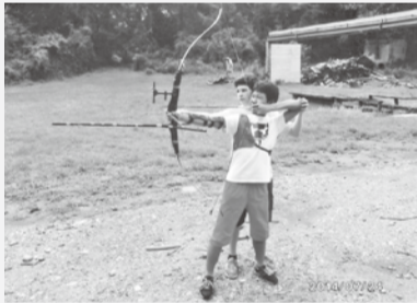
アーチェリーにチャレンジしているところ

僕も彼らの行動を真似して、ほんの少しでも今の日本よりも良い日本にできたらいいなと思いました。