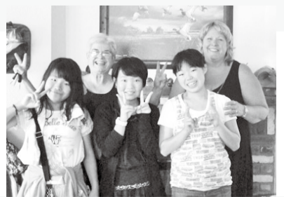
この研修を通して、自分の可能性が広がり、多くのことを学び、自分のものにする事が出来ました。

らないいろいろな気を使ってくださいました。おかげで、日本を思い出すこともなく、楽しい日々を過ごすことが出来ました。この研修を通して、自分の可能性が広がり、多くのことを学び、自分のものにする事が出来ました。そして、最高の仲間と過ごすことが出来た日々は一生の宝物です。このような素晴らしい機会を用意してくださった全ての方々、本当にありがとうございました。