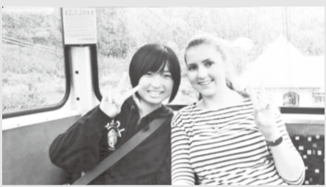
ホストファミリーと黒い森に満足

ドイツでは、エコのことについても学ぶことができました。空になったペットボトルを回収するデポジットや、サッカー場の屋根に太陽光パネルを設置するなど、エコの精神を見習わなければいけないなど強く感じました。