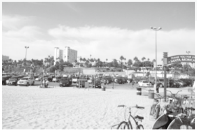
今までコミュニケーション力を鍛え上げたお陰で、11日間、アメリカで有意義に過ごす事が出来ました。これらを通して、活かし、いままです以上に多くの外国人と、積極的にコミュニケーションを取りたいです。