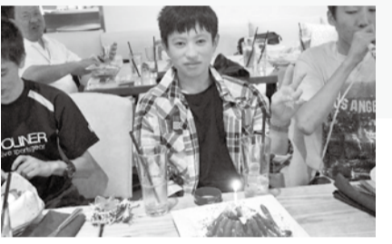
出来そうではなかったのですがなんとか英語で友達と説明して使っていました。そして卓球をして、その時アメリカ人と中国人と日本人の区別が付いていないという事が分かりました。そして卓球の試合が終わりました。

まず、welcome party についてです。僕たちの班はジェスチャーゲームの出しものがありました。準備が完璧ではなく不安でしたがこれが意外に楽しんでもらえました。そしてホストファミリーの人たちとたくさん話しました。しかし、またもや英語であまり分からなかったけど、なんとか伝えたり聞いたりすることができました。野球拳おどろもなんと卓球は、大学生が使っていて、出来そう