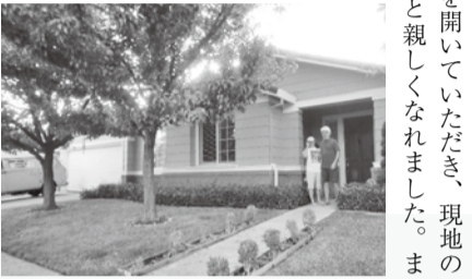
現地のホームパーティーを開いていただき、現地の同じ年くらいの子と親しくなれました。

皆が、はしを使おうとしてくれたことが嬉しかったです。今回の派遣でアメリカに実際に行かないと分からない、日常の風景や雰囲気はたくさん吸収することができました。初の