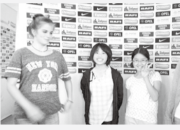
ホストファミリーとフランス

私がこの研修で一番に学んだことは、伝えることがとても大事だということです。初めて来た異国の地で消極的になると、とても損をします。何かを伝えたいという時には、言葉がわからなくても、ポスターや絵で説明するなど工夫をしました。2週間にもわたる、とても貴重な時間を経験させていただき、周りの方々に感謝しています。これらの学んだことを、日々の生活に活かしていきたいです。