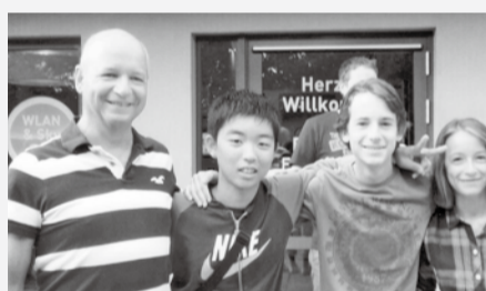
初めてホストファミリーと出会ったとき

トファミリー達を交えていたバーベキューパーティーです。ドイツと日本を交互に盛り、他の友達とホストファミリーとたくさんのお話をすることができました。伝えるのが難しいときは、ジェスチャーをつかってたりして、驚く程に他のホストファミリー達と会話でき、日本のすばらしさを伝えることもできました。食事が終わってからも、他の席に座っていた子達と会話をしに行きました。このときの僕がイキキしていたことは、今でも覚えています。