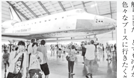
た。最後に生命の世界的プースにいきました。そこではひよこの成長の様子を見ることができたり、心臓の手術の様子を見ることができたり、理系が好きなたたしはととても幸せな時間でした。

この11日間、自分はカリフォルニア州のサクラメントやロサンゼルスなどの様々な場所を訪れ、たくさんの方々の経験をしました。それらの経験はどれも自分にとって良い経験となりました。サクラメントに滞在していた間は、大学生の人達や、ホームステイ先の家族の人達と、たくさん英語を使う機会がありました。自己紹介、部屋や機械の使い方、値下げの交渉、ちょっとしたジョークのやりとりまで全て英語を使うのはとても大変でしたが、相手に自分の英語が伝わって安心しました。塾や学校、そしてなによりまっつやま国際交流センターで学習してきた甲斐がありました。