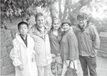
ホストファミリーとフランス