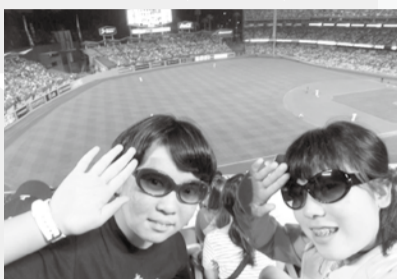
宅へホームステイをしてもっと仲良くなることです。松山にももっと興味を持ってほしいです。そのためにもっと会話を身に付けたいです。本当にありがとうございます。Thank you so much!