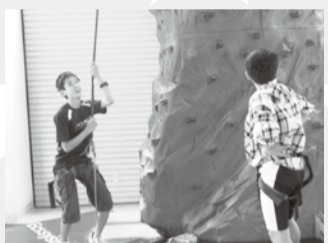
僕は、この海外派遣で、日本では経験できない沢山のことを学ぶことができました。この貴重な経験を、今後活かしていきたいと思っています。この機会を与えてくださったすべての方に感謝します。

また、僕が好きな図書館がいくつもあって、聞くところによると本の数も8万冊ほどあり、大学とは思えないほどでした。JICAは迷子になるくらい広くて校内全部を見ることができず残念でしたが、いつか、このような大学で勉強してみたいと思いました。