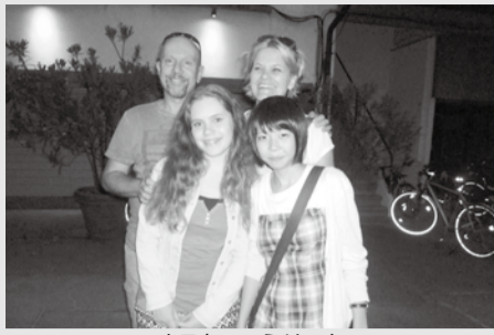
ホストファミリーと

海外派遣を通して、今までの自分の生活を見直すよい機会となり、今後はいろいろな国の出来事にも興味を持ち、生活でできるような心がけたいです。