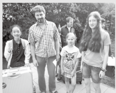
ホストファミリー

今回、このような素晴らしい経験をさせていただいたのは、この派遣で一緒だった仲間、引率の先生方、国際交流センターの方や現地ガイドさん、家族、私のことを温かい目で見てくれたホストファミリー、私を支えてくれた皆さんのおかげです。本当にありがとうございます。