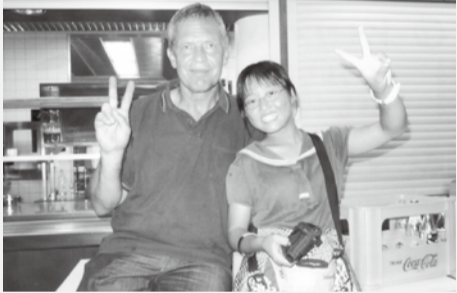
ドイツの学校の先生

あつという間でしたが、充実した研修でした。心を揺さぶるたくさんのお話を、様々なことを考えることができ、学ぶことができました。チャレンジプロジェクトの活動で、これまでに出会った支えてくださ