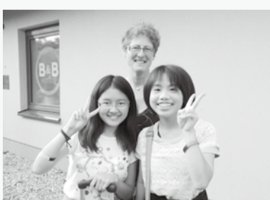
りっちゃんとママと自分

お別れの前日、今までありがとうという気持ちを込めてメッセージを書きました。美しい自然、優しい人々、ドイツで出会ったすべてのことに感謝しています。また、今回の派遣を支えてくださったすべての人にお礼を言いたいです。本当にありがとうございました。