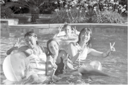
最後に、このアメリカ班のメンバーと過ごせたのは、親や引率の先生方の支えがあったからです。

全てを通して感じたことは、人とのつながりです。現地の人は初対面の私たちにも、快くフレンドリーに話してくれました。また、様々な面でスケールの大きさに驚きました。何事にもオープンで心の広さはもちろん、身長の違いや家にプールがあったり天井が高かったりすること、道路の幅にもびっくりしました。アメリカをしっかりと感じることが出来ました。